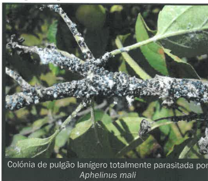
Colônia de pulgão lanígero totalmente parasitada por Aphelinus mali

Nesta época do ano, pode-se observar nos pomares o efeito da ação do parasitoide do pulgão lanígero ( Aphelinus mali ). Se é este o caso do seu pomar, não faça agora qualquer tratamento contra o pulgão-lanígero.