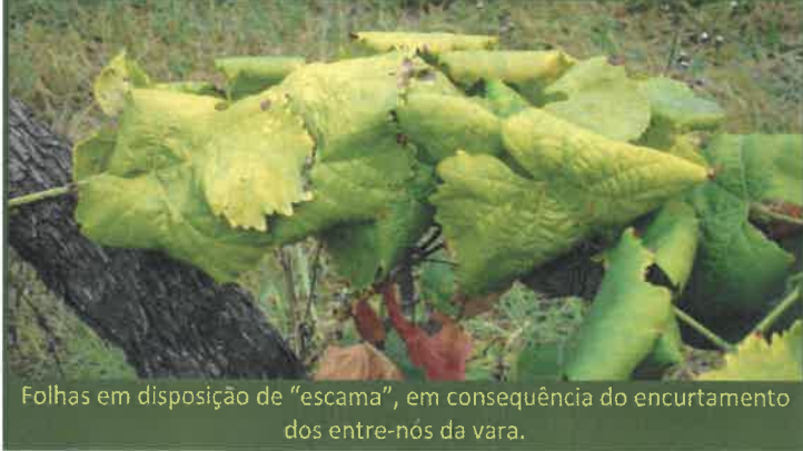
Folhas em disposição de "escama", em consequência do encurtamento dos entre-nós da vara.