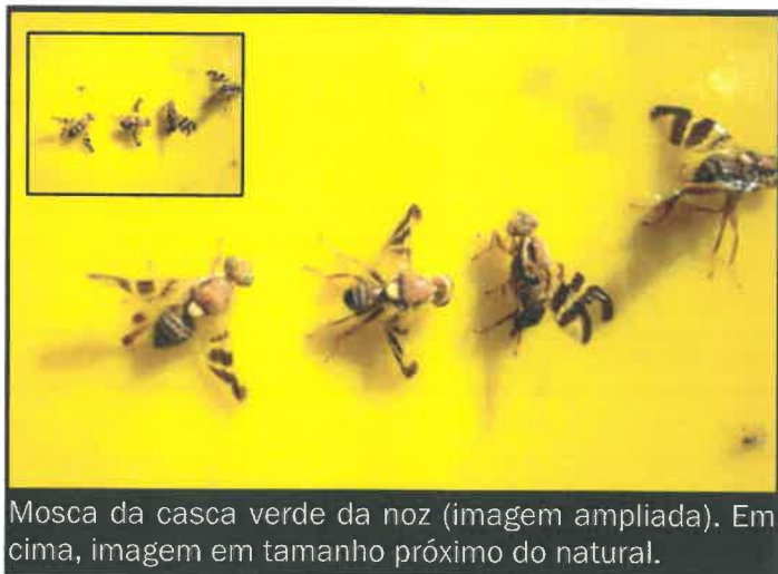
Mosca da casca verde da noz (imagem ampliada). Em cima, imagem em tamanho próximo do natural.

Coloque uma placa cromotrópica amarela nas suas nogueiras e observe dia sim - dia não. Quando começar a capturar exemplares da mosca da casca verde ou se observar os primeiros sintomas nas nozes, aplique um inseticida homologado para o combate a esta praga.