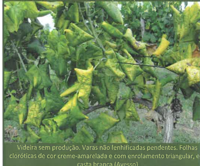
Videira sem produção. Varas não lenhificadas pendentes. Folhas cloróticas de cor creme-amarelada e com enrolamento triangular, em casta branca (Avesso)