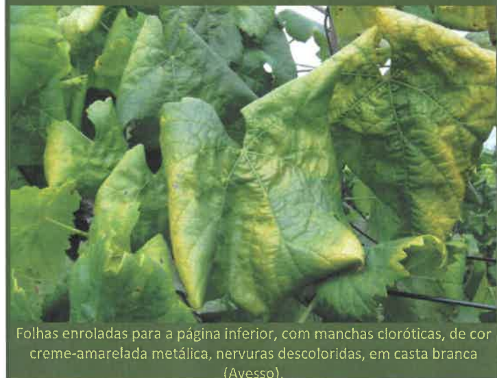
Folhas enroladas para a página inferior, com manchas cloróticas, de cor creme-amarelada metálica, nervuras descoloridas, em casta branca (Avesso).