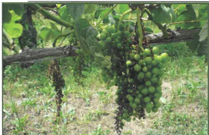
Perda de produção em casta branca (Arinto). Cachos parcial ou totalmente secos.