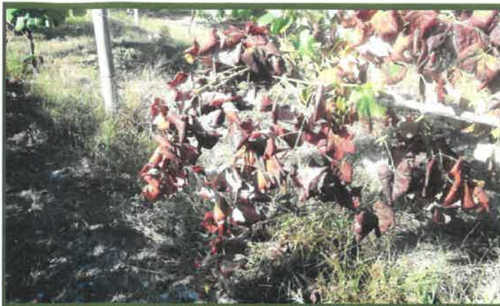
Videira sem produção. Varas não lenhificadas pendentes, folhas cloróticas de cor avermelhada e com enrolamento triangular, em casta tinta (Vinhão).