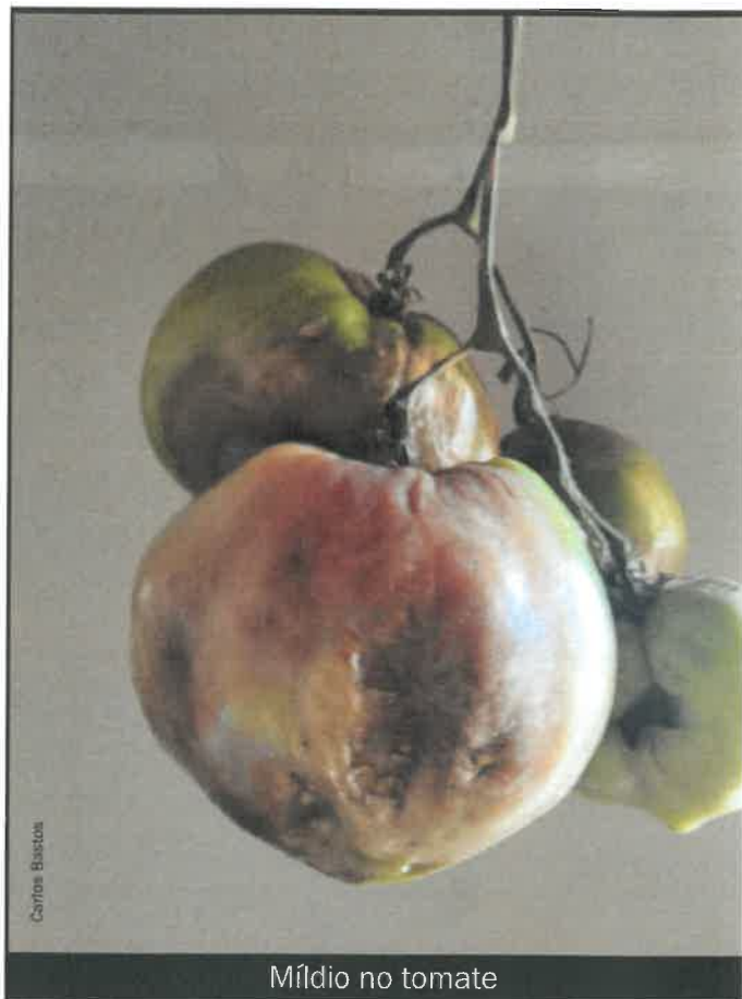
Míldio no tomate

da batateira e possui elevada virulência e capacidade de destruição das plantas atacadas.