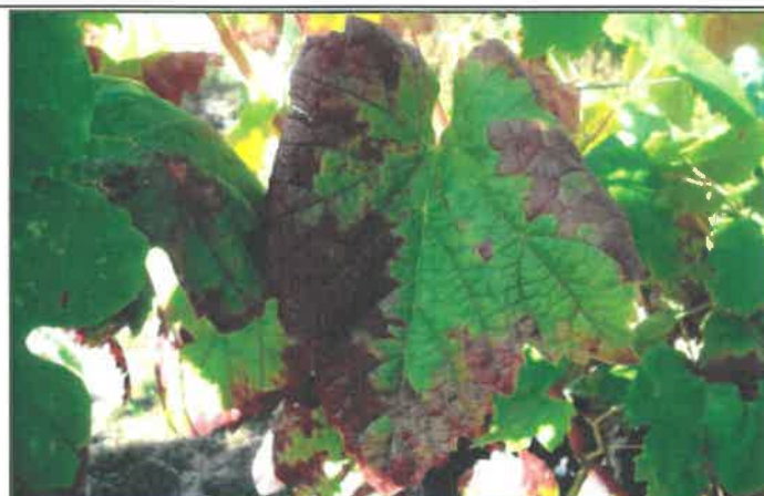
Manchas cloróticas em casta tinta (Vinhão) Varas não lenhificadas