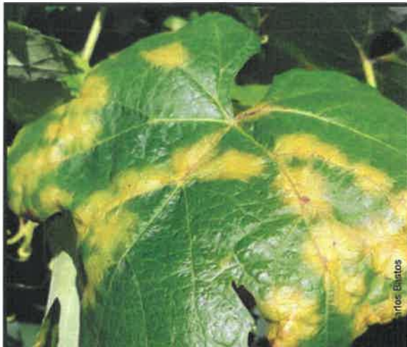
Míldio esporulado nas folhas e pâmpanos

desenvolvimento desta e de outras doenças da Vinha