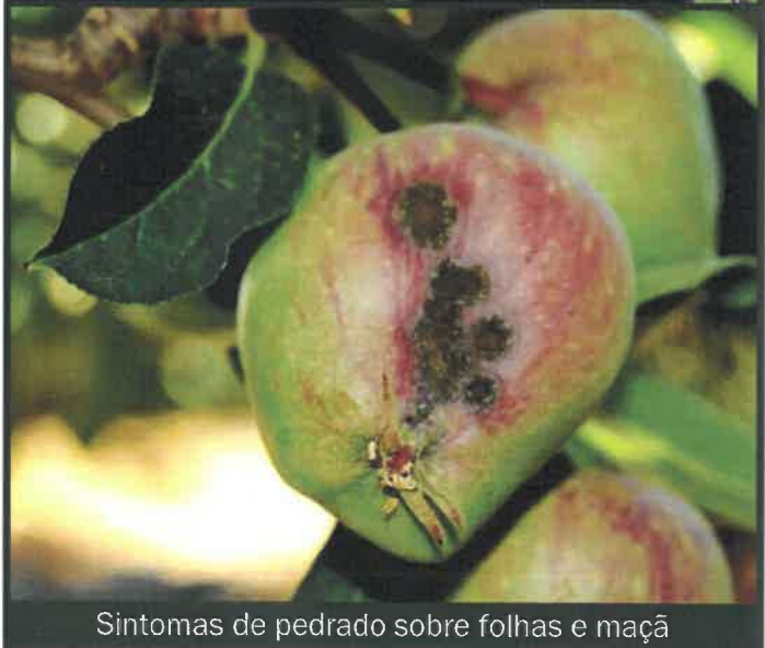
Sintomas de pedrado sobre folhas e maçã